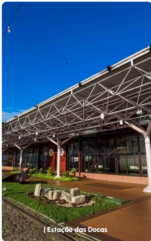
| Estação das Docas

Café da manhã. A capital paraense desponta como grande roteiro turístico do Brasil , gerando uma excelente oportunidade para investimentos turísticos , e está entre as 10 cidades mais movimentadas e atraentes do Brasil e a mais visitada da Amazônia . Visita panorâmica pela cidade de Belém, conhecendo seus principais pontos turísticos: Praça da República. Teatro da Paz. Estação das Docas, Ver-o- peso, Cidade Velha com visita a Catedral. Após almoço (não incluso) visita ao Mangal das garças e visita a Basílica de Nazaré. Tempo livre. À noite sugerimos (não incluso no pacote) passeio a Estação das Docas. Criada a partir da restauração do antigo porto de Belém, a Estação das Docas é um convite ao passeio pela orla da Baía do Guajará. Referência nacional para o turismo e cultura na Amazônia, que faz do complexo turístico-cultural um grande centro de lazer na cidade de Belém. Pernoite.