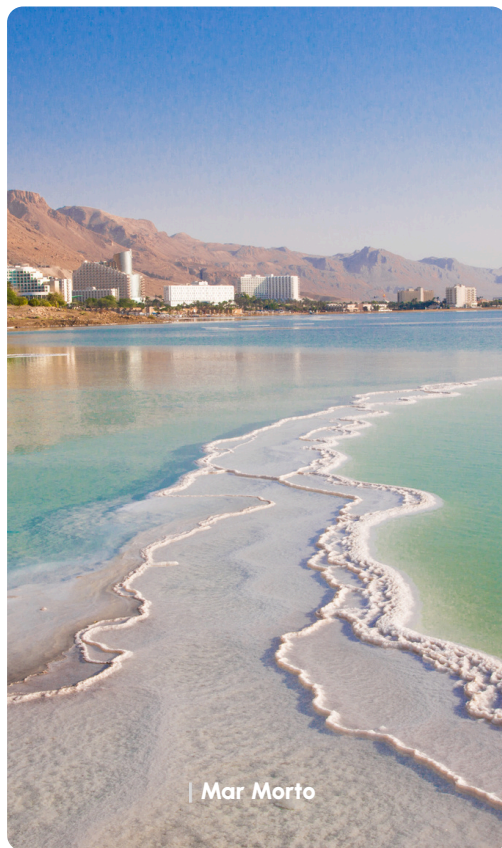
| Mar Morto

Saída para o aeroporto de Madri para embarque com destino a Fortaleza.