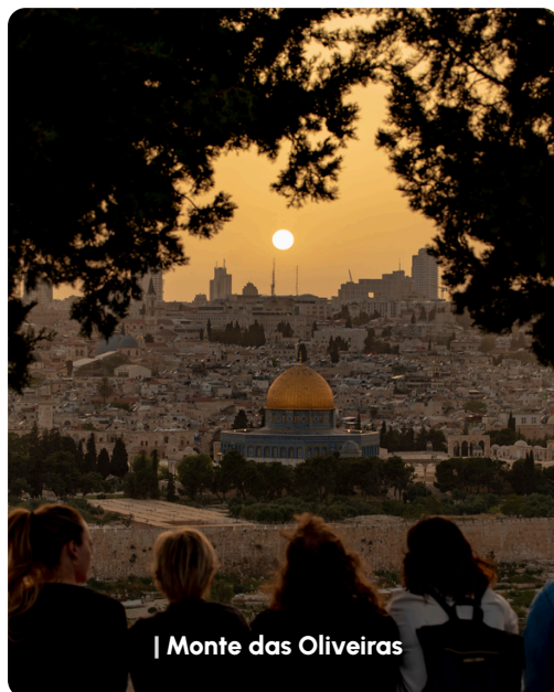
| Monte das Oliveiras