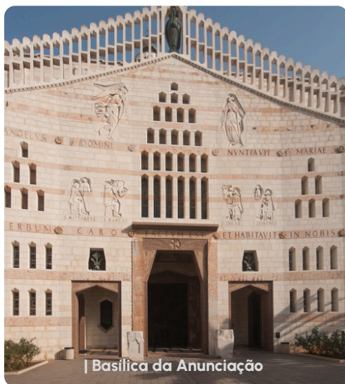
| Basílica da Anunciação

Café da manhã. Visita panorâmica pela cidade. Visita a Jope , também conhecida como Jaffa, localizada na costa mediterrânea de Israel. É um lugar histórico e significativo para judeus e cristãos. Com raízes que remontam a 1800 a.C. Jope é mencionada na Bíblia como a cidade de onde o profeta Jonas saiu antes de ser engolido pelo grande peixe. Jope é também conhecida por ser o lugar onde o rei Salomão trouxe os materiais de construção para o Templo de Salmão. Uma das principais atrações turísticas de Jaffa é a casa de Simão o Curtidor. Porque segundo livro de Atos dos Apóstolos, é nessa casa onde São Pedro teve uma visão divina que mudou sua percepção sobre a conversão de gentios ao cristianismo. Assim casa é um símbolo importante da unidade e do diálogo entre diferentes culturas e religiões. Saída pela costa mediterrânea rumo a Cesárea Marítima, antiga capital Romana construída por Herodes que a dedicou ao imperador romano César Augusto, e também residência oficial de Pilatos. Saída para Haifa. Visita do Monte Carmelo , onde o Profeta ELIAS desafiou os 450 Profetas de BAAL. Visita a Igreja de Stella Maris e Gruta do Profeta Elias . Saída para Nazaré. Visita a Basílica da Anunciação (MISSA) e a Igreja de São José com visita ao local onde, segundo a tradição, seria a sua carpintaria. Saída para Tiberíades . Acomodação no hotel. Jantar . Pernoite.